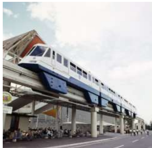
【EXPO'70 開催当時に走行していた当時のモノレール車両】