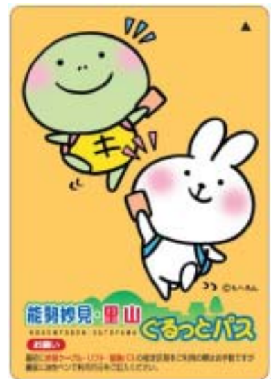
チケットデザイン