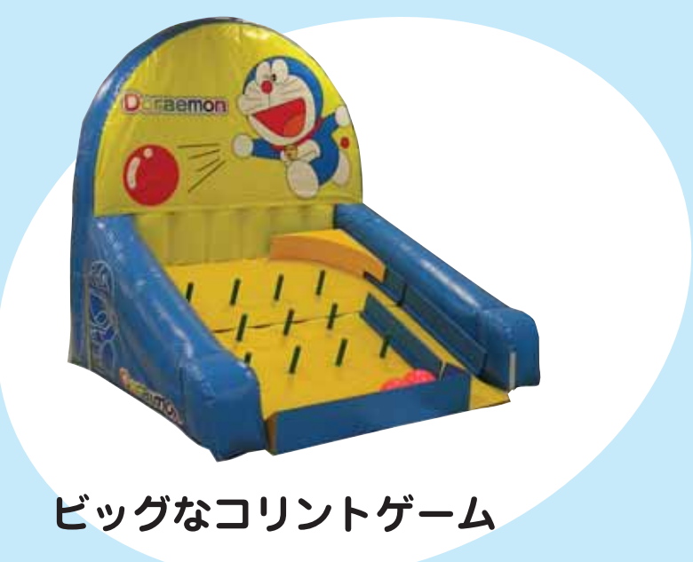
ビッグなコリントゲーム