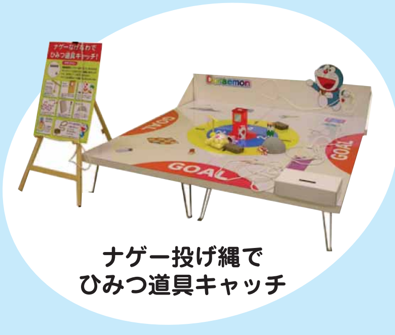
ナゲー投げ縄で ひみつ道具キャッチ