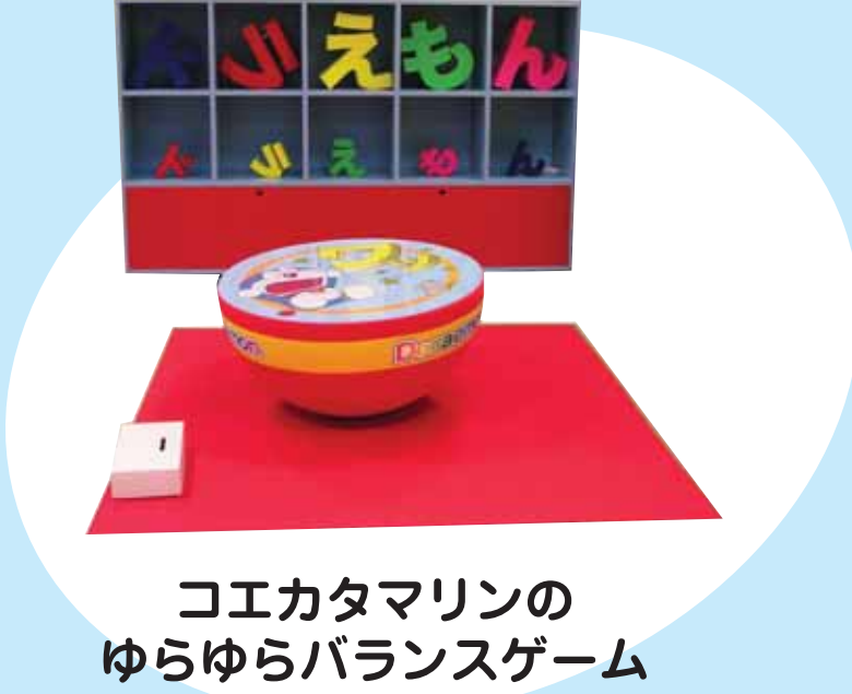
コエカタマリンの ゆらゆらバランスゲーム