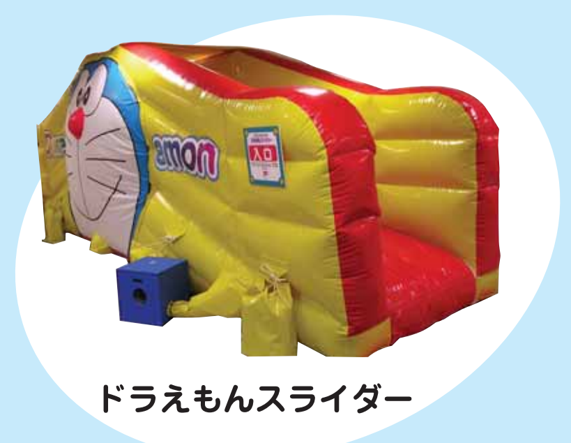
ドラえもんスライダー