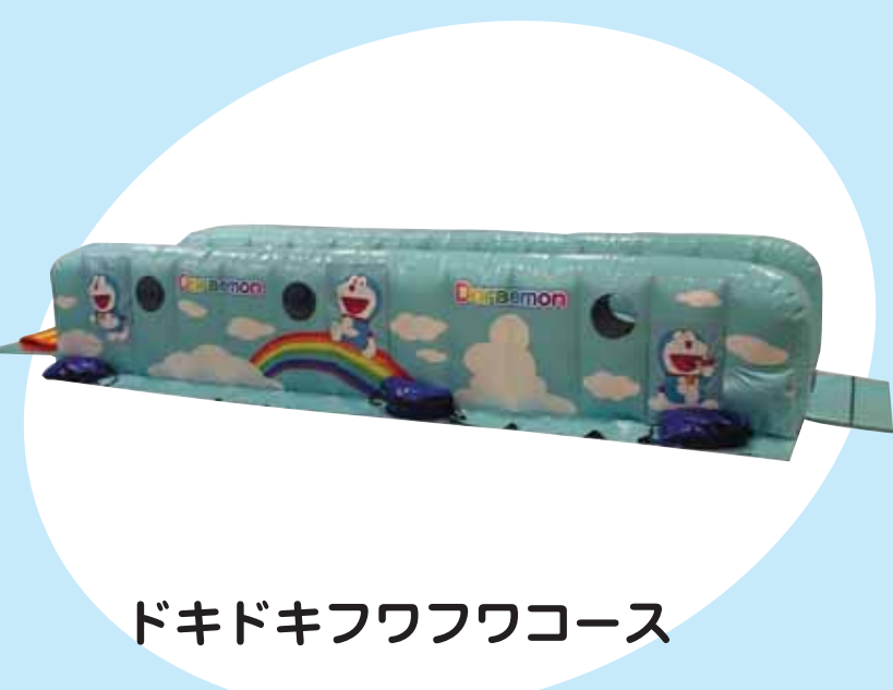
ドキドキフワフワコース