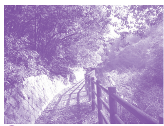
A 鉢伏山自然歩道 木もれ日の道を森林浴。