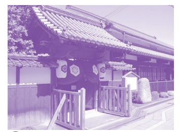
B 郡山宿本陣 江戸時代に西国大名などが宿泊した。