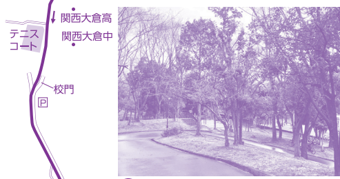
C 郡山公園 豊かな樹林で特に秋の紅葉が楽しめる。

●ご自分の体力、体調をチェックされた上で歩きましょう。●歩きやすい服装、弁当、飲み物、雨具などを準備しましょう。●けがや他に与えた損害等については、当社は一切の責任を負いません。●交通量の多い車道の近くを歩く区間があります。●諸般の事情でコースやスポットの様子が異なる場合があります。●交通ルールを守り、地域の住民や施設などに迷惑をかけないよう、マナーに気をつけましょう。