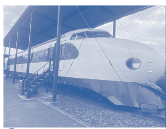
A 新幹線公園 新幹線先頭車両0系と戦後の代表的機関車EF15型が展示されている。春には桜がトンネル状に咲く。