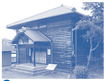
C 旧一津屋公会堂 1913年(大正2年)に地元の農家など、160世帯が出資して建てられた、かつての娯楽の殿堂。