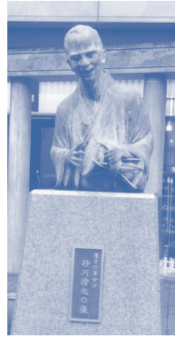
B 砂川捨丸の像 格式高く改革した 現在漫才の「祖」と呼ばれている