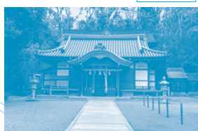
吉志部神社 四百余年の時を超えて 鮮やかに蘇った社殿