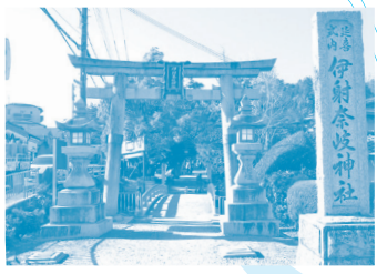
いざなぎ 伊射奈岐神社 本殿は大阪府指定有形文化財。