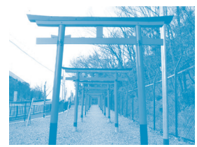
千里丘稲荷神社 朱色の鳥居が続く階段の先に 社殿があります。