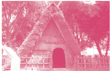
① 田能遺跡 弥生時代の住居や高床倉庫などを復元している。