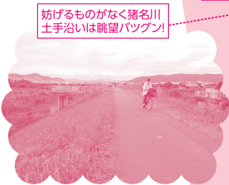
妨げるものがなく猪名川土手沿いは眺望バツグン!