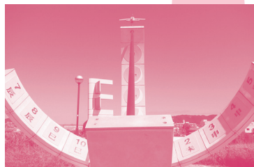
③ エア・フロント・オアシス 下河原 飛び立つ飛行機が真下から見えて迫力があります。