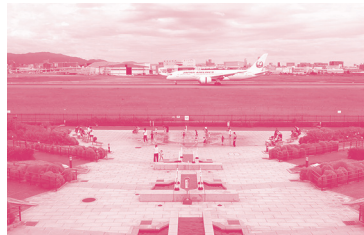
② 伊丹スカイパーク (スカイテラスから) 連なった丘からは飛行機の離発着を間近に見ることができる。