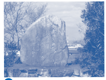
B 千本つきの歌碑 淀川堤防工事の際、杵を上げ下ろして土を固めながら歌った歌詞が刻まれています。

●ご自分の体力、体調をチェックした上で歩きましょう。●歩きやすい服装、弁当、飲み物、雨具などを準備しましょう。●けがや他に与えた損害等については、当社は一切の責任を負いません。●交通量の多い車道の近くを歩く区間があります。●諸般の事情でコースやスポットの様子が異なる場合があります。●交通ルールを守り、地域の住民や施設などに迷惑をかけないよう、マナーに気をつけましょう。