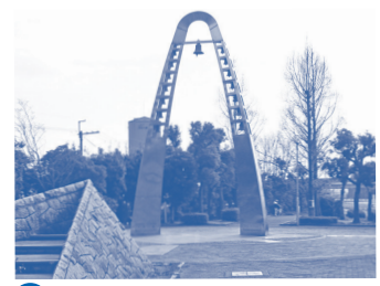
D 平和公園 広島から送られた高さ9mのカリヨンは一日3回メロディーを奏で、梅林や花見も楽しめます。