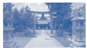
C 味舌天満宮 織田信長の甥の織田大和守尚長が造った神社