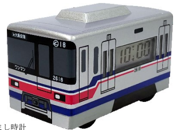
モノレール目覚まし時計 (細部のデザインは変更となる場合があります)