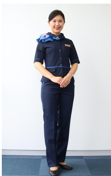
夏制服 パンツスタイル