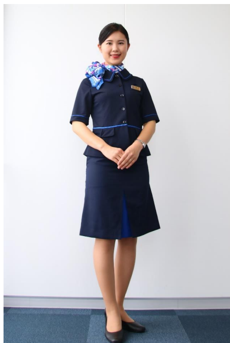
夏制服 スカートスタイル