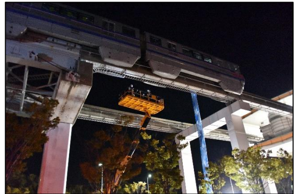
高所作業車を使用した点検