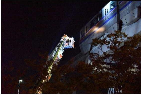
はしご車による救出