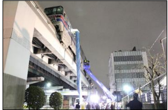
脱出シュータによる救出