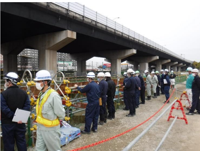
現場パトロール実施状況