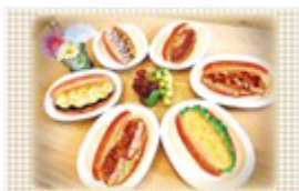
こぺてりあ 質面店