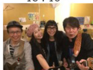
アクションブリケ