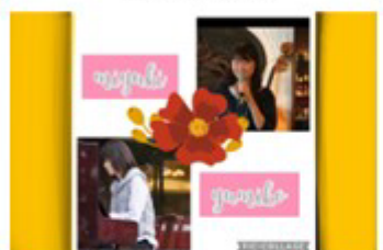
miyuki & yumiko