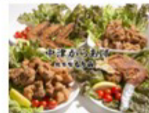
中津からあげ総本家 もり山