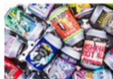
スタンドうみねこ