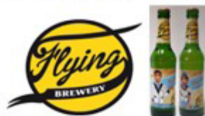
Ein Bier, Bitte. (ドイツビール)