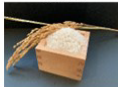
自然農園ころころ