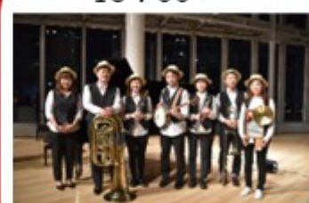
とよなかディキシーランド