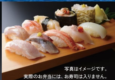
写真はイメージです。 実際のお弁当には、お寿司は入りません。