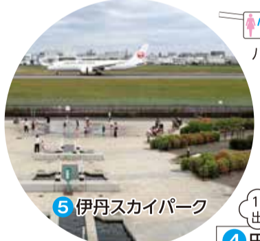
5 伊丹スカイパーク