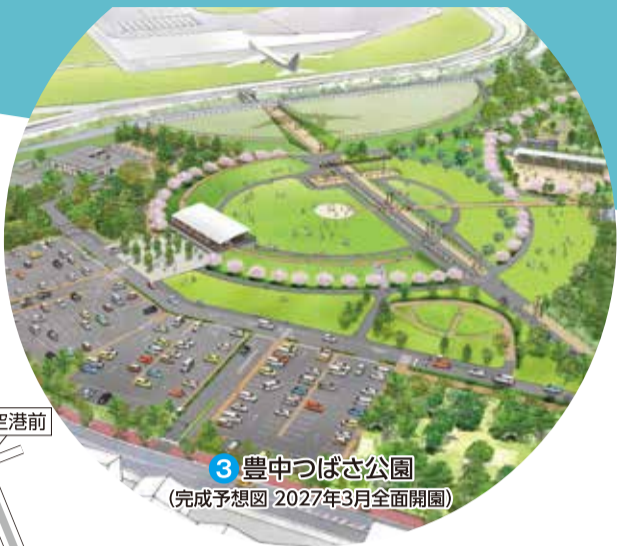
3 豊中つばさ公園 (完成予想図 2027年3月全面開園)