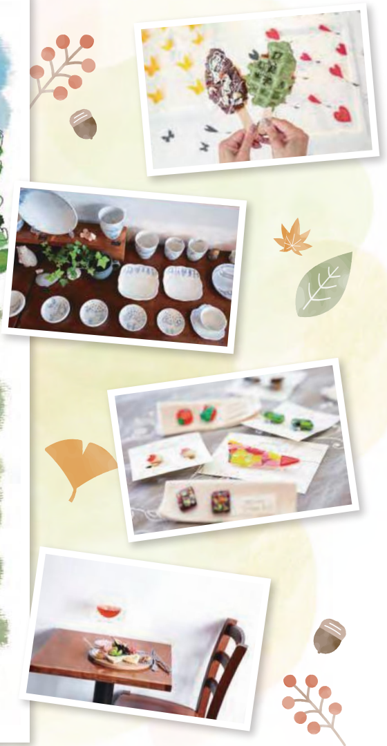
表紙イラスト：近藤さやか