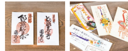
ご本尊の阿彌陀如来(左)と西国七福神めぐりの福祿寿(右)の御朱印(各300円)。お守りも各種揃います。

本尊である、「木造漆箔阿彌陀如来像」は有形文化財とされており、また西国七福神「福祿寿尊」を祀る寺院としても親しまれています。また明治27年に日本で初めて、ベースボールに「野に遊ぶ球技」として『野球』という訳語をつけた中馬庚(ちゅうまかのえ)のお墓もあります。