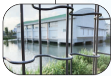
体育館が池の上に!

豊中市蛭池中町4-5-23 TEL.06-4400-3826 営|11:00~17:00 日曜・月曜・木曜定休 https://stsugunoniwa.storeinfo.jp/ Instagram@tsugunoniwa ◎「蛭池駅」より徒歩7分