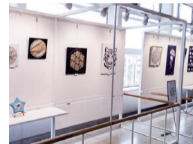
少路駅モノギャラリー