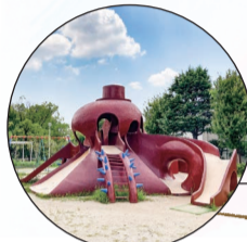
たこの滑り台が子どもに人気