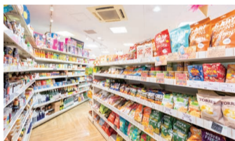
上)「Blythe(ブライス)」のトップショップの称号を持つ同店ならではのラインナップ。 下)スナック菓子やガムもバラエティ豊かに。