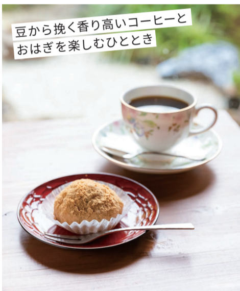
豆から挽く香り高いコーヒーとおはぎを楽しむひととき