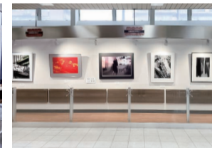
門真市駅モノギャラリー

【募集期間】2023年10月1日(日)~10月31日(火) 【お問い合わせ】大阪モノレールサービス株式会社 モノギャラリー係 TEL.06-6902-8017(平日9:00~17:45/土・日・祝除く)