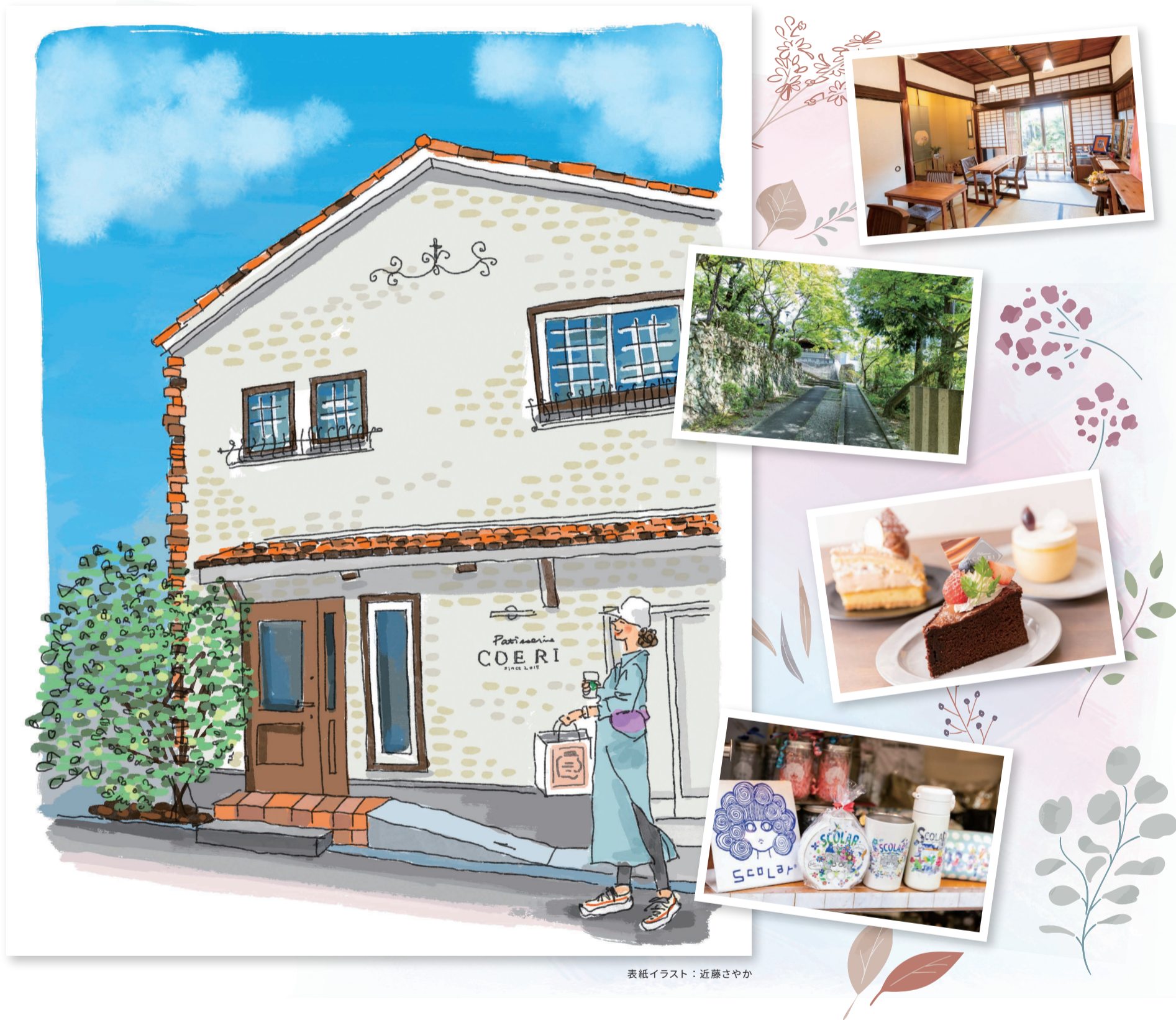
表紙イラスト：近藤さやか