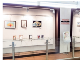
蛍池駅モノギャラリー

2024年度の『モノギャラリー』展示作品を募集します。『モノギャラリー』は、大阪モノレールの蛍池駅・少路駅・門真市駅に設けている、地域の皆さまの絵画や写真等の作品を2週間ごとに入れ替えて展示するスペースです。詳しくはホームページをご覧ください。