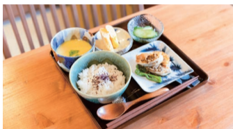
おはぎと同じ四万十川流域の仁井田(いいた)米を使った「むしやしないセット(1,000円)」。お好きなドリンクも付いています。