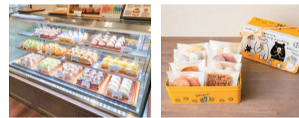
8種類のクッキーが入ったクッキー缶(1,950円)はちょっとしたお礼や手土産にもおすすめ。