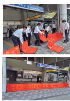
上)止水板を設置する様子 下)止水板設置完了