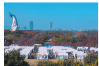
日本最大級の屋外鉄道イベント

【日程】2026年 11/28(土)・11/29(日) 【時間】9:30~16:00(予定) 【場所】万博記念公園「東の広場」、「EXPO70パビリオン」ほか 【入場料】無料 ※別途、万博記念公園入園料 大人(高校生以上)450円が必要 【テーマ】鉄道がつなぐ観光の未来 【主催】大阪モノレール株式会社、大阪モノレールサービス株式会社、大阪府、吹田市 【内容】日本各地の鉄道会社や自治体等による物販・PRなど 【交通】観光連携ゾーン(物販・PR) ■旅情くつろぎゾーン(観光列車展・折り鶴体験所) ■ステージゾーン ■子どもファミリーゾーン ■グルメゾーン ■道具(有料)ゾーン等 ※内容は変更する場合があります。