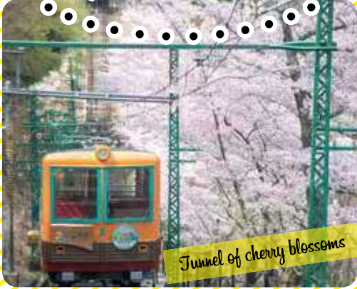
Tunnel of cherry blossoms