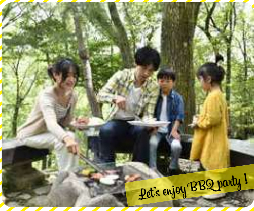
Let's enjoy BBQ party!