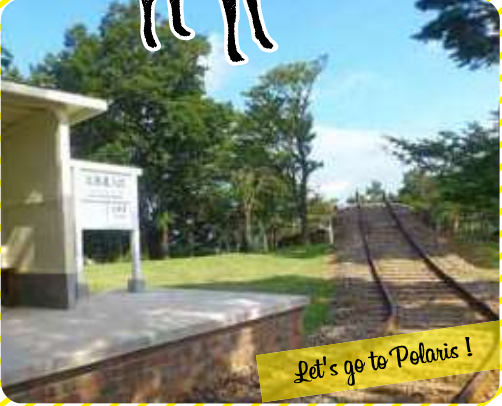
Let's go to Polaris!