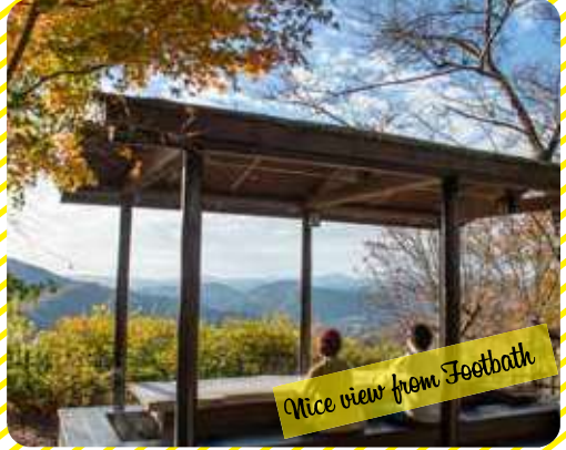
Nice view from Footbath