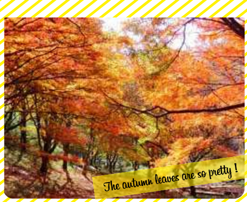
The autumn leaves are so pretty!

※花や自然の状況は、その年の天候などによって変わります。あらかじめご了承ください。