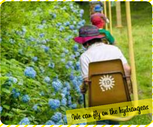
We can fly on the hydrangeas